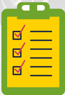
Skriveredskaber til dokumentation*